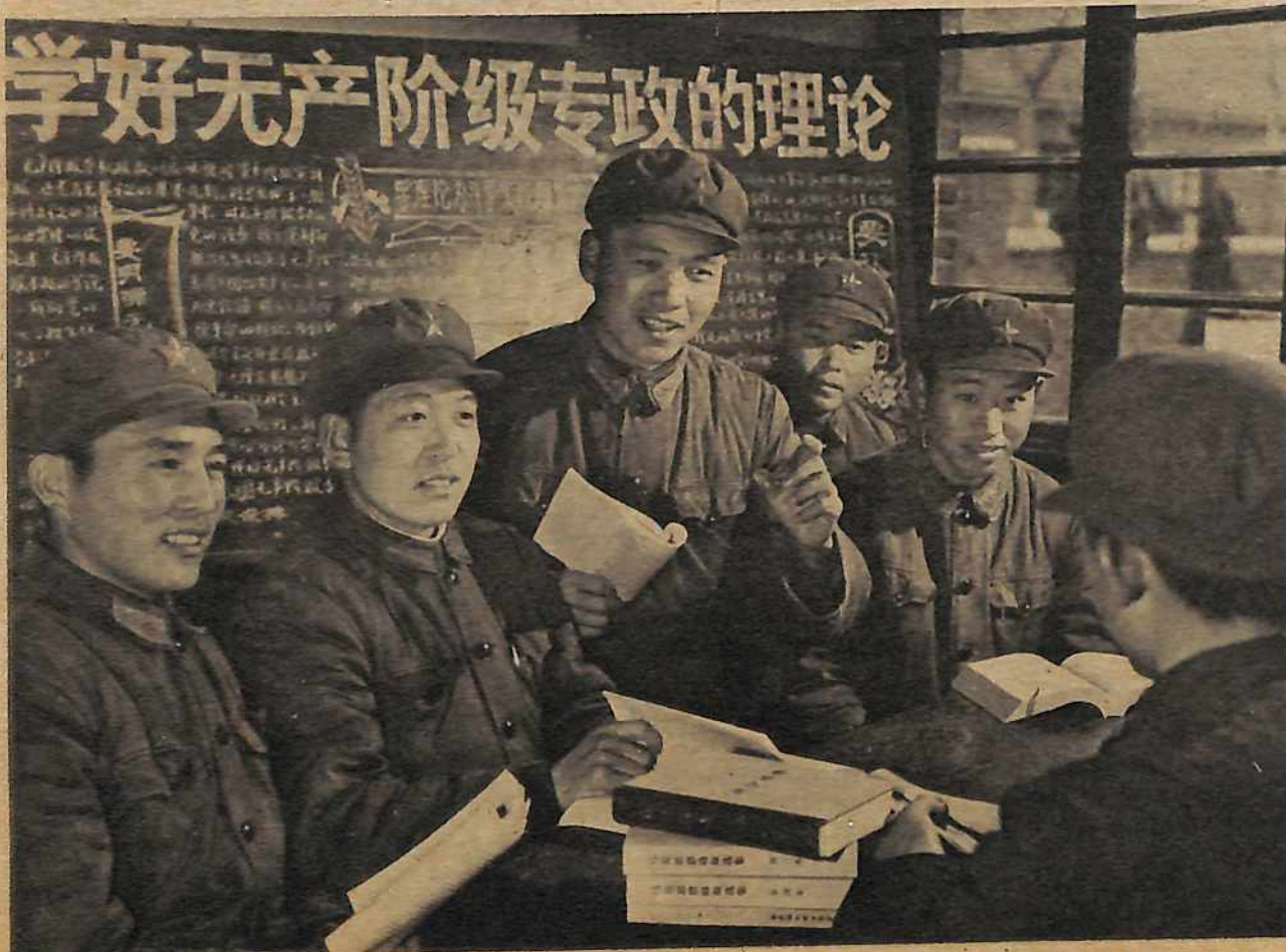
Soldados del Ejército Popular de Liberación estudian y discuten la cuestión de porque es esencial la dictadura del proletariado. Esta campaña importante iniciada por Mao Tsetung es una lucha importante para avanzar el entendimiento y dominio de la clase obrera sobre la sociedad y para combatir a los seguidores del camino capitalista.