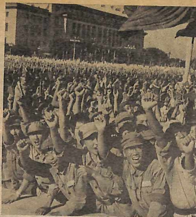
Al apogeo de la Revolución Cultural jóvenes Guardias Rojas saludan a Mao Tsetung, quien le dió a su movimiento un gran apoyo.

Durante este período, Mao y otros líderes revolucionarios trataron de desarrollar el modo de movilizar las masas mismas para derrotar estos atentados capitalistas y para dar golpes a los seguidores del camino capitalista que promovieron estos atentados. Finalmente, en 1966, tal forma estaba desarrollado—La Gran Revolución Cultural Proletaria, así llamada porque empezó y tuvo mucho de su enfoque en la cuestión de revolucionar la cultura, para quitar del teatro los representantes de las clases explotadoras y su vista reaccionaria y reemplazarlos con las figuras y obras de arte y cultura que ponen adelante los representantes de la clase obrera y las masas mismas luchando no sólo para derrotar los explotadores viejos, pero para continuar la revolución para derrotar