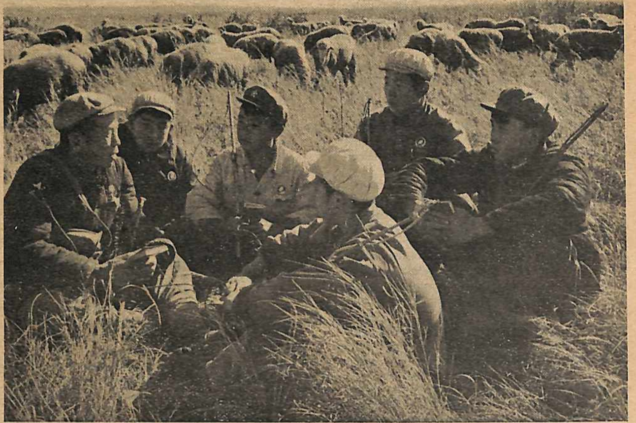
Un oficial del gobierno (a la izquierda) en un "Escuela de Cuadros 7 de Mayo," viviendo y trabajando por un plazo entre los campesinos. Esta política y otras semejantes desarrolladas mayormente durante la Revolución Cultural son llamadas "cosas nuevas socialistas." Son pasos importantes para restringir las diferencias principales en la sociedad, incluso la diferencia entre la ciudad y el campo, entre el obrero y el campesino, y entre el trabajo manual y el intelectual, y así ayudan a sentar la base para la sociedad comunista futura donde el conocimiento no se podrá monopolizar por interés personal y la gente obrera dominará todos aspectos de la sociedad. La existencia continua de tales cosas y su desarrollo ha sido y seguirá siendo un enfoque de lucha de clases aguda entre las fuerzas revolucionarias y los que quieren volver atrás al capitalismo.

Mao habla de "gentes como Lin Piao." ¿Quiénes son tales gentes? Son los que emergen dentro del Partido Comunista y el estado socialista, especialmente en los niveles altos, y que se aprovechan de sus posiciones de liderato para la base de empujar sus propios intereses