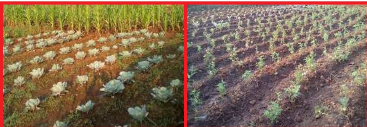
పార్టీ పిలుపునందుకొని ప్రజా అభివృద్ధి, స్వావలంబనలో భాగంగా, కూరగాయలు పండిస్తూ ఆణివోసే రైతాంగం

ప్రజల గ్రామం. అయితే వీరు ఆంధ్రప్రదేశ్‌లో, ఆదివాసీలుగా గుర్తింపు పొందారు. ఒడిషాలో వారికి ఆదివాసీలుగా గుర్తింపు లేదు. ఈ గ్రామంలో 30-35 కుటుంబాలున్నాయి. అందరూ వ్యవసాయం మీద ఆధారపడే జీవిస్తున్నారు. కానీ ఈ గ్రామంలో వ్యవసాయ కూలి, పేదరైతాంగం అధికంగానే ఉన్నారు. అయితే గ్రామ పెత్తందారు (నాయక్) చేతిలో 50 ఎకరాలకు పైబడిన మెరుగైన సాగు భూములు ఉన్నాయి. అందులో కూలీల ద్వారా పని చేయించి, వారి శ్రమను దోపిడీ చేయడం ద్వారా, ఆర్థికంగా అభివృద్ధి చెంది, రాజకీయంగా ప్రజలపై ఆధిపత్యాన్ని చలాయించేవాడు. అందులో కొంత భూమిని సాగు చేయకుండా బీడుగా వదిలేసి, దానిపై తన హక్కును నిలుపుకున్నాడు తప్ప, భూమిలేని పేదలకు సెంటు భూమి కూడా సాగు చేయడానికి అనుమతి నివ్వలేదు. వయస్సు పెరిగి, ముసలితనంతో అతడు చనిపోతే, ఆ భూములపై హక్కు మాదేనంటూ అల్లుడు యజమానిగా ముందుకు వచ్చాడు. ఈ గ్రామంలోని విప్లవ రైతు కూలి సంఘం, ఆ భూముల స్వాధీనం కోసం ప్రజలకు పిలుపునిచ్చింది. దీంతో ప్రజలు సంఘ నాయకత్వంలో, భూస్వామిని ప్రజా పంచాయితీకి లాగి, ఆ భూమిపై భూమిలేని పేదలకే హక్కు వుందని తీర్పు చెప్పారు. భూస్వామి ప్రజల తీర్పును ఆమోదిస్తూ, అంగీకరించక తప్పలేదు. ఆ తర్వాత 15 ఎకరాల పొలం భూమిని, 20 ఎకరాల చెలక భూములను సంఘం నాయకత్వంలో స్వాధీనం చేసుకొని, గ్రామంలో భూమిలేని పేదరైతాంగానికి చెందిన, 20 కుటుంబాలకు పంపిణీ చేయడం జరిగింది. ఆ భూములను ప్రజలు సమిష్టి శ్రమ ద్వారా సాగుకు యోగ్యంగా తయారు చేసుకొని, వంటలు వేసుకున్నారు. ఈ పోరాటం ద్వారా భూమిని